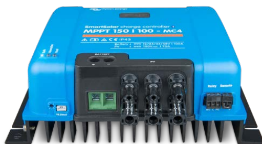
Controlador de carga solar MPPT 150/100-MC4 Sin pantalla