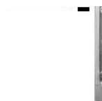
Fig 1. How to connect the output neutral to ground, and location of DC input fuse