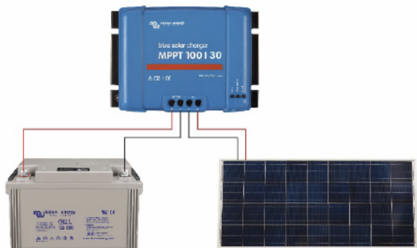
Figure 1: Power connections