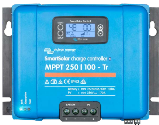
Controlador de carga solar MPPT 250/100-Tr Con dispositivo conectable