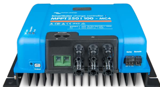
Controlador de carga solar MPPT 250/100-MC4 Sin pantalla